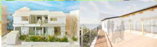
たまよん完成イメージ図①